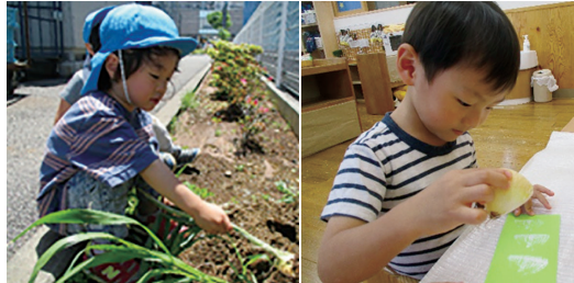
たまねぎの収穫(左) たまねぎのスタンプで工作

花壇に季節の野菜を育てています。土から芽が出て大きくなっていく姿を見て成長を感じ、見慣れた野菜に育つのを楽しみにしています。水やりは2歳児、収穫は1・2歳児。給食で食べたり、保育の製作材料になったりもします。