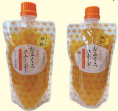
*おふくろスムージー みかんと柚子・みかんと檸檬はデポーのみの取り扱いです。

おふくろスムージーが気に入っています。薄皮ごとみかんが入っていて、独特な食感も好きです。冷やしても、少し凍らせてもおいしく、食欲が落ちている夏にもピッタリでした。