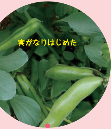
実がなりはじめた