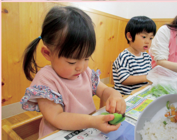
そらまめの皮をむいて、お昼にみんなで食べました。おいしかった!