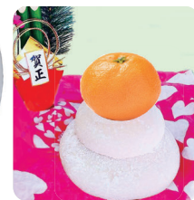
はぐくみ隊(2ページ)の皆さんと年末にはお餅つきをして、鏡餅を飾ったよ。