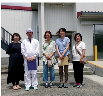
どではら会の黒米の生産者にインタビュー(写真左)。那須塩原市にある新生酪農の栃木工場にて(右)