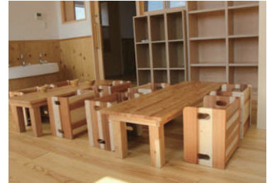
天然の木材に囲まれた環境

床材は国産の無垢の杉板、机や椅子や棚・いろいろな玩具も木製で、木の温かさを直接感じられます。床は保育士が年数回、えごまのワックスがけをしています。